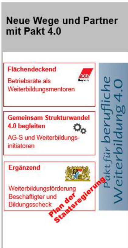
Verteilung der Weiterbildungsinitiatoren